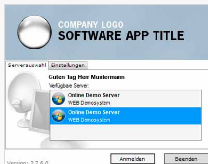
Anmeldung mit One Touch Demo Client

Ihre Interessenten erleben sofort wie einfach und zuverlässig Ihre Software arbeitet!