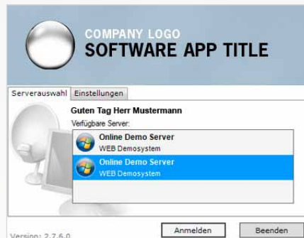
Anmeldung mit One Touch Demo Client

Ihre Interessenten erleben sofort wie einfach und zuverlässig Ihre Software arbeitet!